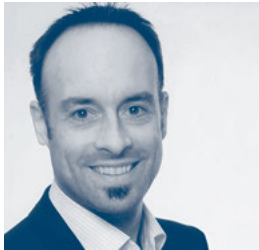
Dr. David Janele

Suchtpatienten gehören mit zu den am schwierigsten zu motivierenden Patienten im Maßregelvollzug. Bereits bei der Aufnahme müssen daher entscheidende Grundbausteine für den Therapieerfolg gelegt werden. Der Vortrag soll den praktischen Umgang mit zunächst vorwiegend extrinsisch motivierten Patienten beleuchten und auf die